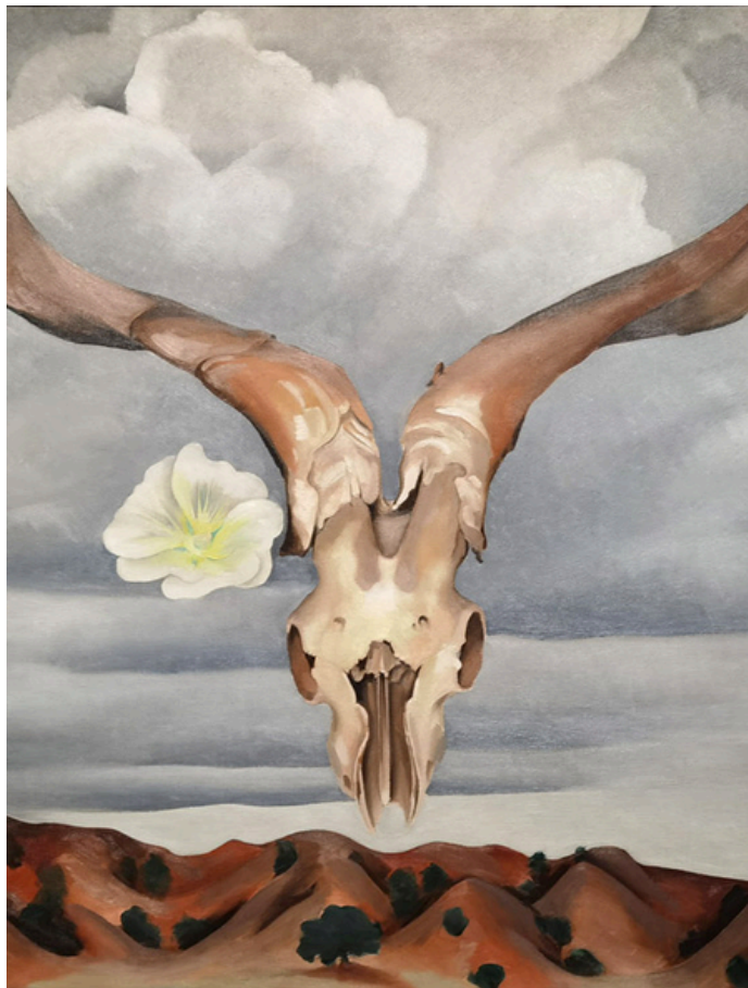
Cabeza de carnero, malva real blanca. Colinas, 1935

Como artista de prestigio nacional, Georgia O'Keeffe ha sido muy conocida en Estados Unidos durante muchas décadas. Más recientemente, su arte ha comenzado a atraer atención y elogios similares en el extranjero.